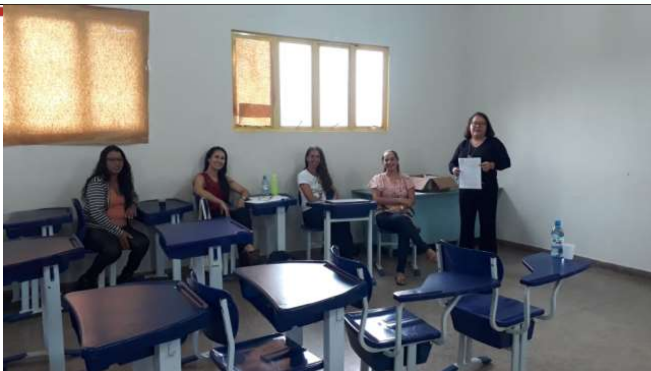
Atividades da sexta-feira, 22/11, noite: Conferência e Encerramento e Avaliação do Evento