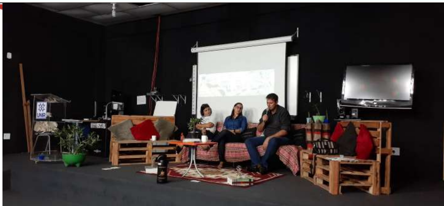
Atividades da quinta-feira, 21/11, noite: Mesa-Redonda “Inclusão, pautas identitárias e diversidade na atuação docente”