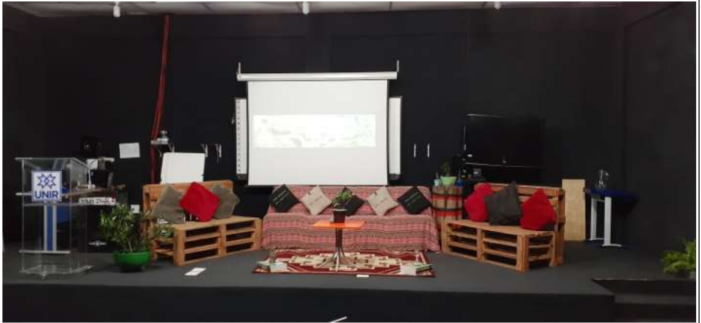
Cerimônia e Conferência de Abertura: 20/11