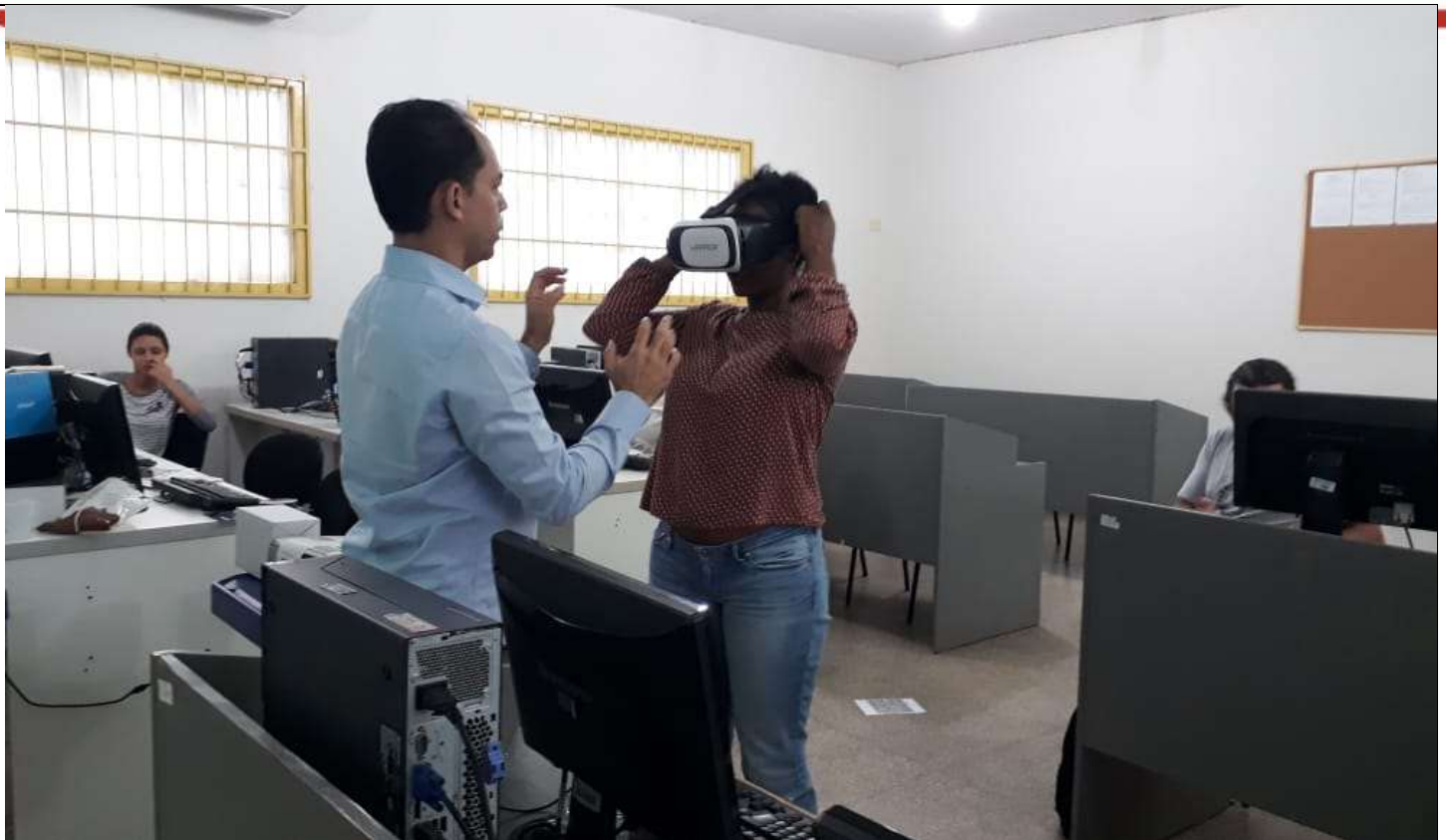
Atividades da sexta-feira, 22/11, tarde: Simpósios Temáticos