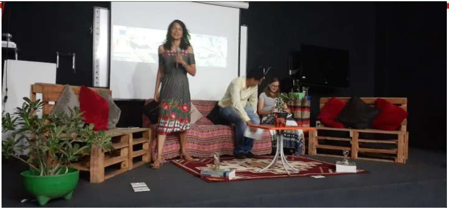
Atividades da sexta-feira, 22/11, manhã: Minicursos